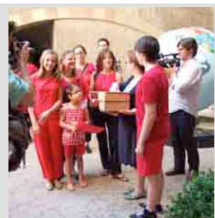
25 mai 2011 / Dépôt en dansant des 4'683 signatures au Conseil d'État et au Grand Conseil. De tous les messages écrits et posés sur le sol de la cour de l'Hôtel de Ville nous avons retenu : L'Atelier c'est trop de la balle !