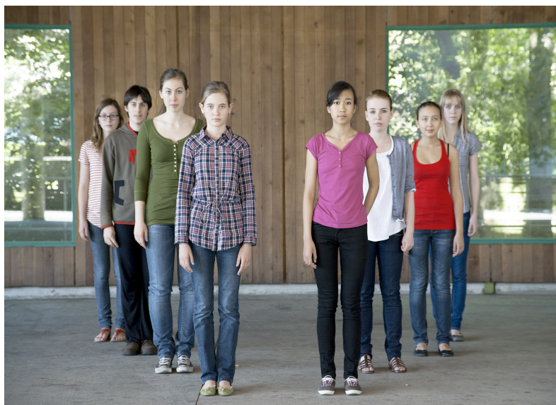
Compagnie Virevolte

du 17 au 21 septembre 2011 - Théâtre du Galpon